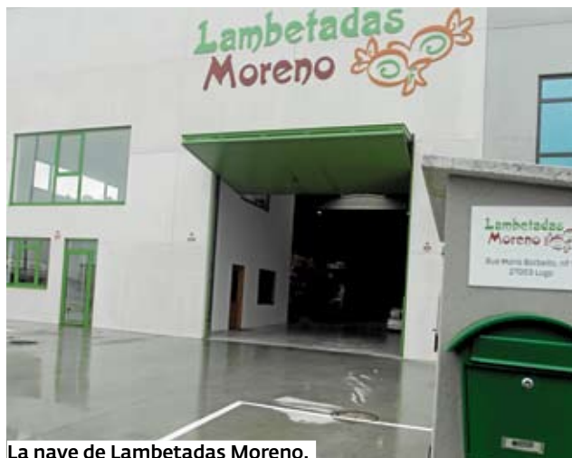
La nave de Lambetadas Moreno.

ch; un amplio abanico de bombones y chocolates belgas, Hamlet y Cachet, así como la excelencia de Lindt; Galletas Cuetara; Artia-ch; Bollería selecta doña Isabel; Bombones Ferrero Rocher; Chocولاتinas Kinder, Kit Kat, Tokke, Twix, m&m's; especias e infusiones La Barraca; chicles Trident, Orbit; caramelos Halls, Smint; gominolas Haribo, Vidal, Dammel; Chupa chups, la gama Fiesta; patatas Pringles; la riquísima tarta de nuez chocolate de Tartesa, así como tartas Ancano, explica