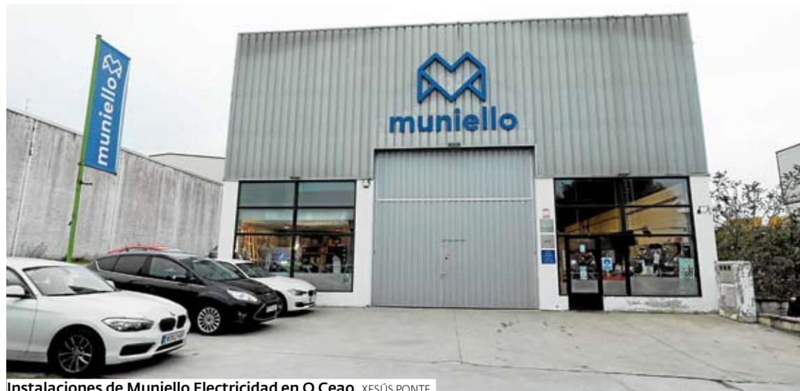
Instalaciones de Muniello Electricidad en O Ceao. XESÚS PONTE

Disponen de todo tipo de iluminación para empresas y proporcionan asesoramiento profesional a sus clientes, desarrollando proyectos cuando estos se lo demandan.