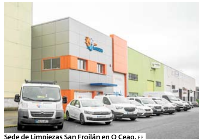
Sede de Limpiezas San Froilán en O Ceao. EP