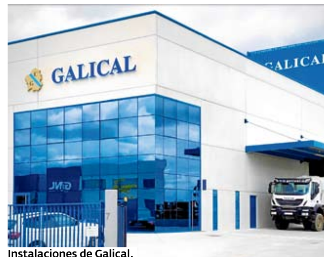
Instalaciones de Galical.

La empresa lucense cuenta también con una flota propia de camiones equipados con GPS para enclavo agrícola. Este sistema