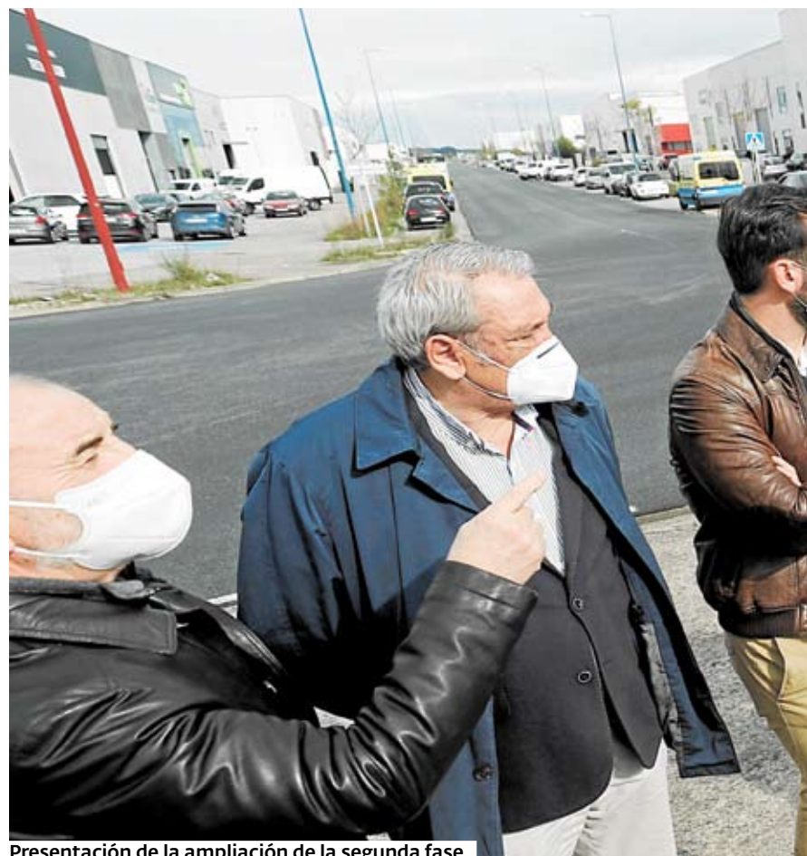
Presentación de la ampliación de la segunda fase.

La consellería de Medio Ambiente, Territorio e Vivenda confía en que se puedan simultanear las obras de urbanización de la segunda fase del parque con las de construcción de esta gran superficie comercial en el que está considerado como el segundo parque empresarial de Galicia,