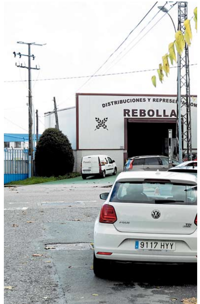
Los empresarios solicitan que se soterran todas las líneas aún existentes.

O Ceao y As Gándaras comparten además el problema de la dimensión de algunas medianas, que dificultan el giro en el caso de camiones muy grande. Aunque el de As Gándaras es un polígono nuevo sufre también este problema.