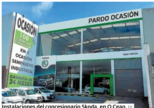
Instalaciones del concesionario Skoda, en O Ceao.

Pardo Automoción es una de las empresas que además cuenta con todos los servicios de asesoramiento para la compra de vehículos nuevos de Skoda y recogida de los usados, así como para las tareas adecuadas en su mantenimiento. Hablar de Skoda y de Pardo Automoción en Lugo es hacerlo de toda una garantía a la hora de citar a alguna firma en el mundo del motor. En O Ceao dispone de instalaciones y perso-