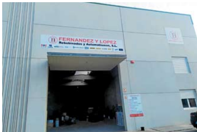
La nave de Fernández y López Rebobinados y Automatismos.

En las nuevas instalaciones de las que dispone Fernández y López Rebobinados y Automatismos SL en el polígono empresarial de As Gándaras «se mejora el servicio al ampliarse el abanico de posibilidades que se