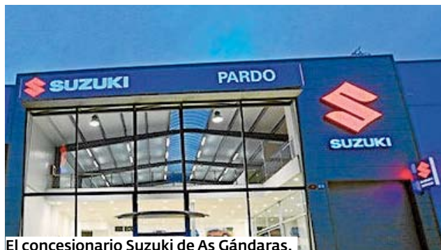
El concesionario Suzuki de As Gándaras.

Pero si lo que el consumidor busca es un vehículo de ocasión, el concesionario dis-