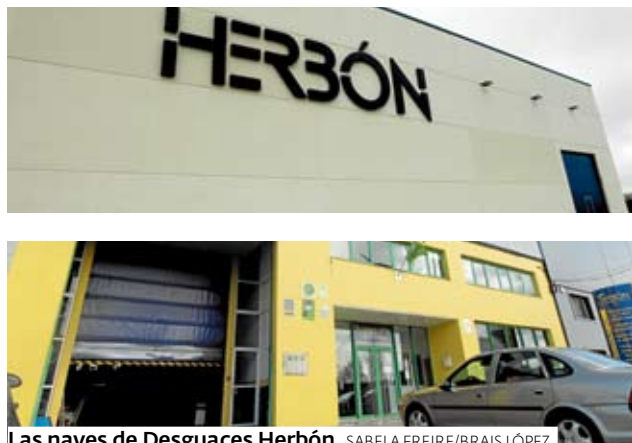
Las naves de Desguaces Herbón.