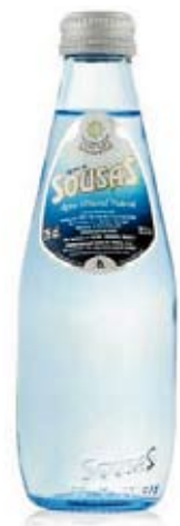
Aguas de Sousas.

La presencia de este agua en la amplia oferta de productos del Grupo Revoltosa evidencia la apuesta de este grupo lucense por el agua de calidad.