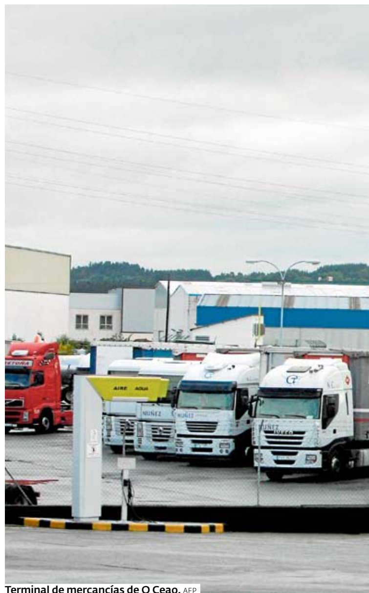
Terminal de mercancías de O Ceao. AEP

Asimismo, los empresarios asociados pueden disfrutar de los beneficios del Programa Cero Comisiones de Abanca, que les permite dejar de pagar por el mantenimiento de cuentas y tarjetas, pero también por transferencias, ingreso de cheques u otros servicios habituales. Abanca también pondrá a disposición de estos profesionales la banca electrónica, Broker Online o Abanca Pay, así como el servicio Appuntame, para gestionar fácilmente cualquier tipo de cuotas, domiciliaciones o suscripciones tanto para ellos como para sus clientes.