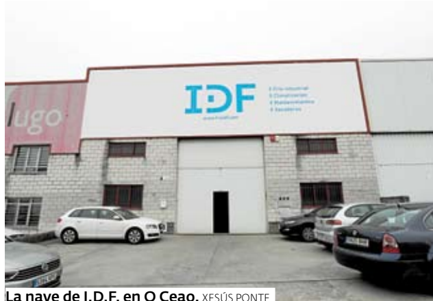
La nave de I.D.F. en O Ceao. XESÚS PONTE

A actividade fundamental desta empresa é o frío industrial. Ofrece aire acondicionado