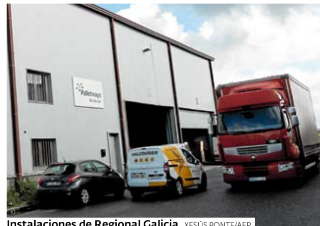
Instalaciones de Regional Galicia.