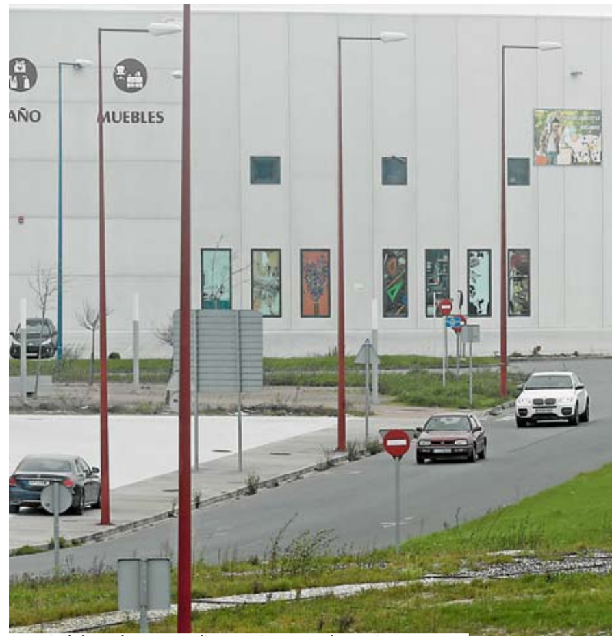
Las administraciones contribuyen al asentamiento de empresas.

Alrededor de 400 empresas dan vida a diario a esta importante área empresarial, albergando además de a los trabajadores directos «a mucha otra gente, a quienes vienen a descargar, y a muchos profesionales de diferentes sectores», indican desde esta agrupación