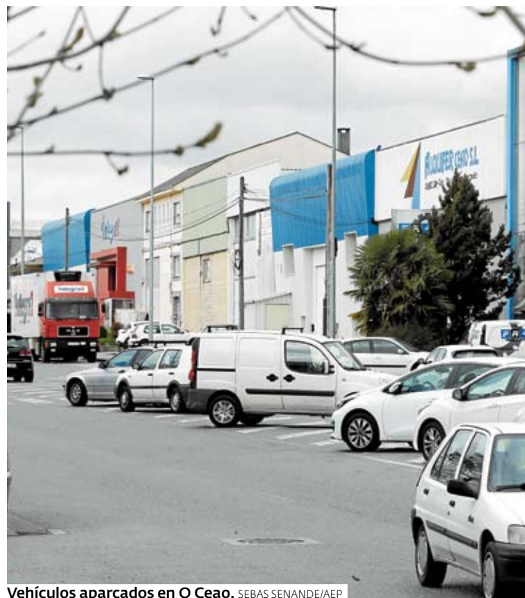
Vehículos aparcados en O Ceao.

del polígono de O Ceao requieren una actuación urgente, pues varias calles presentan numerosos socavones.