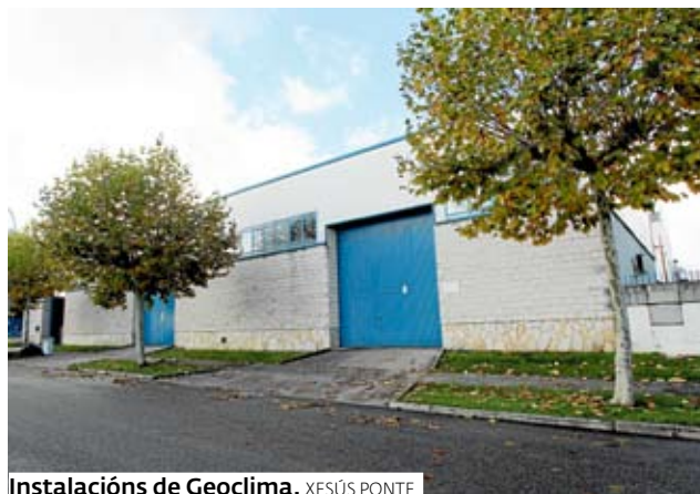
Instalación de Geoclimate. XESÚS PONTE

A raíz de esto se elabora un proyecto a medida en el que el objetivo principal es conseguir un ambiente agradable con el