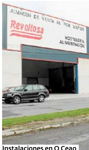
Instalaciones en O Ceao

Distribuye los productos de La Revoltosa, como la conocida marca de gaseosas, y Aguas de San Joaquín. También es distribuidor en exclusiva para Galicia de los productos de marcas tan prestigiosas como Aguas de Sousas, Heineken, Bodegas Do Campo (D.O. Ribeiro) o Guímaro, uno de los caldos más prestigiosos de la Ribeira Sacra; jamones,