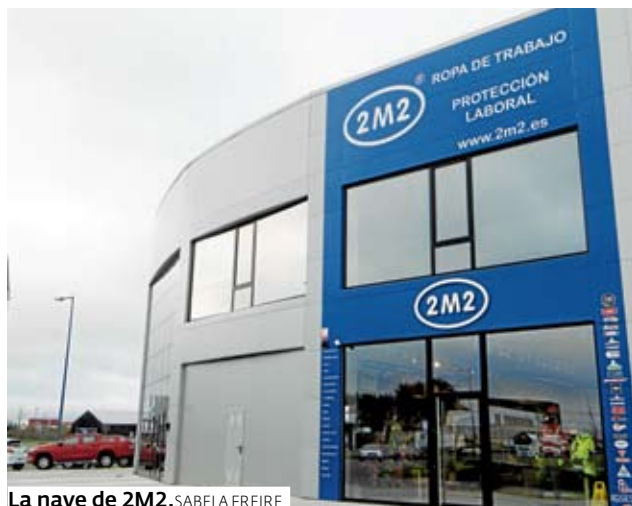
La nave de 2M2. SABELA FREIRE

2M2 es distribuidor de las principales marcas del sector, con unos precios muy competitivos y un grandísimo stock. «Es una mejora para la empresa, porque tenemos unas instalaciones más grandes y somos la