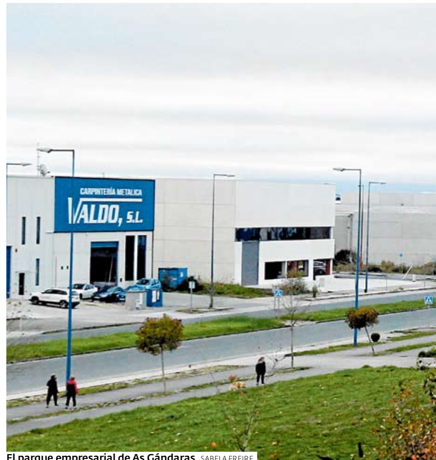
El parque empresarial de As Gándaras. SABELA FREIRE

ma situación afecta a outras dúas vías, previstas na nova fase de ampliación do parque, e que serán a continuación da rúa F e a nova rúa M. Polo tanto, facemos