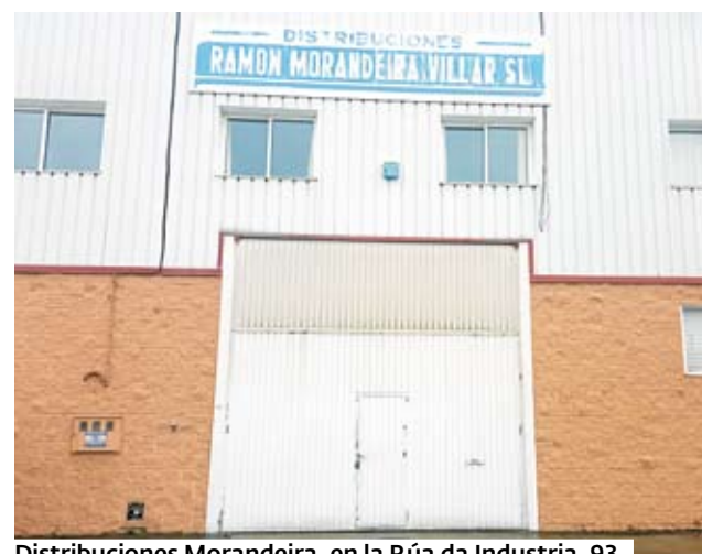
Distribuciones Morandeira, en la Rúa da Industria, 93.

las instalaciones para ofertar al público, en general, sus productos en distribución.