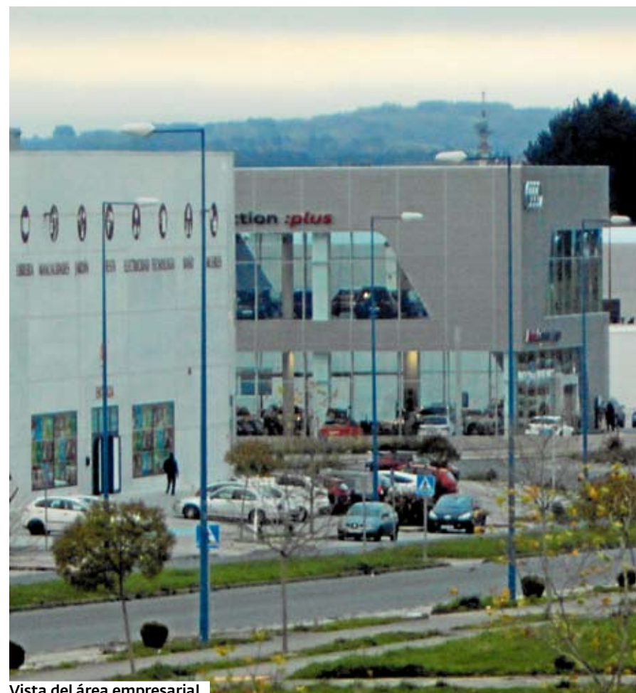
Vista del área empresarial.

Los empresarios insisten que la creación de un punto limpio para los residuos industriales que diese servicio a ambos polígonos supondría una notable mejoría tanto para hu-