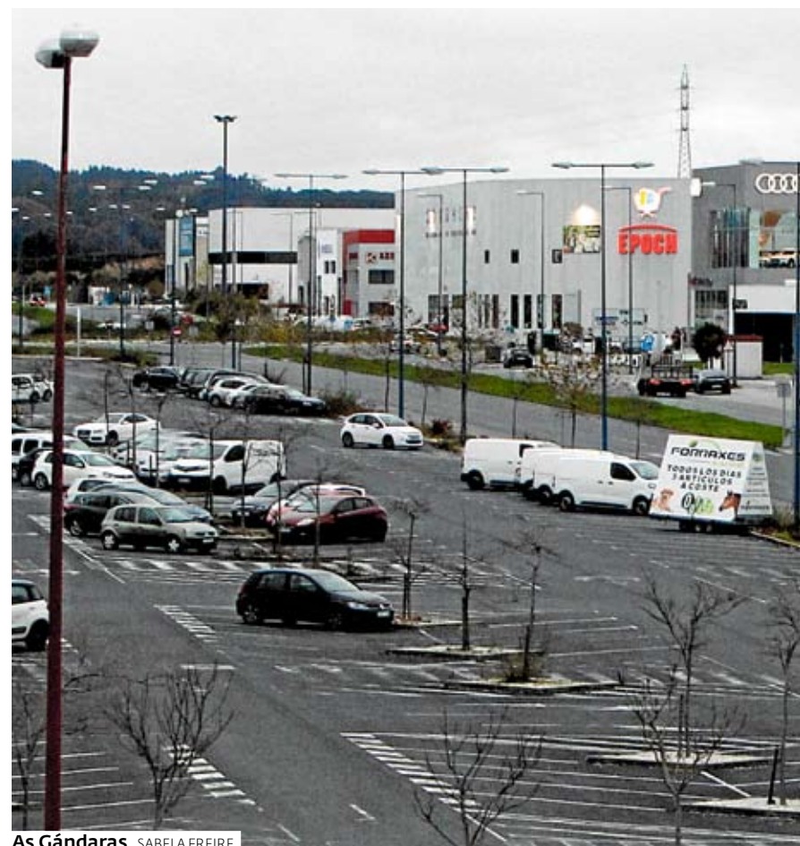
As Gándaras. SABELA FREIRE

Con el crecimiento del parque empresarial de As Gándaras también se incrementa la necesidad de aumentar las medidas de seguridad. Algunos empresarios comentan la posibilidad de estudiar detenidamente si es posi-