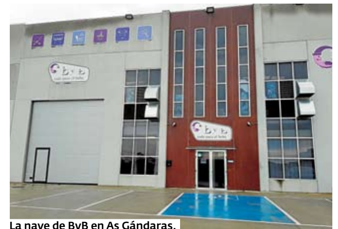
La nave de ByB en As Gándaras.

Trabajan con las marcas más prestigiosas del mercado, como Axkid, Römer, GB, Concord y BB Confort, junto a nuevas incorporaciones como la marca Klipan, firmas reconocidas que avalan la calidad que ofrece ByB en sus productos. Las sillas con airbag incorporado son otros artículos novedosos que se ofrecen en esta tienda. Junto a la mayoría de las marcas mencionadas, en carrocetas también es posible encontrar propuestas de BB Car, Jané y Silver Cross, así como la reciente incorporación de Jool.