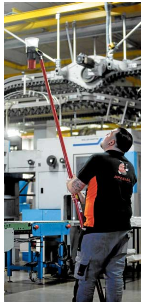
Comprobaciones de seguridad en la rotativa de El Progreso y el hotel Forum, en O Ceao ADRA PALLÓN

Otro de los requisitos exigidos es que los equipos y sistemas cumplan con la normativa que regía en el momento de su instalación, así como que las operaciones de mantenimiento también sean acordes a la normativa. La principal modificación introducida por el reglamento vigente es la obligatoriedad de la realización de las revisiones trimestrales.