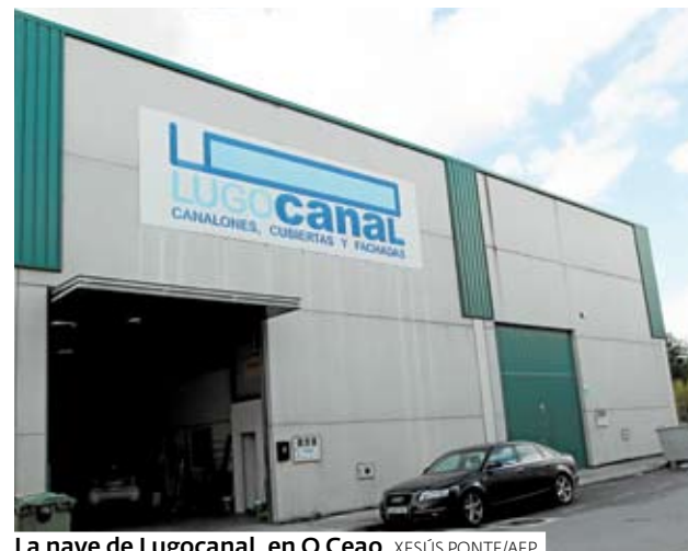
La nave de Lugocanal, en O Ceao.