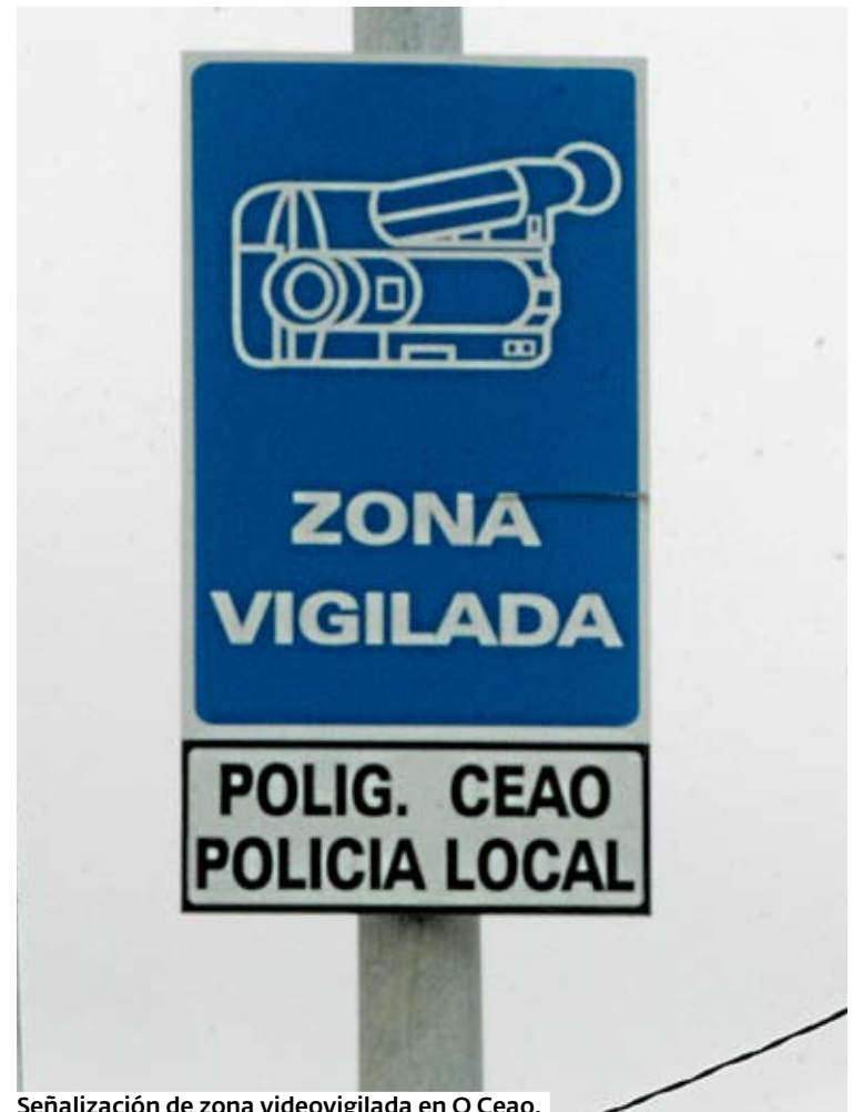
Señalización de zona videovigilada en O Ceao.

La reactivación de las cámaras de videovigilancia y su mantenimiento tiene que ser autorizada por la delegación del Gobierno en Galicia. La instalación de las cámaras, cofinanciada por la Unión Europea, tuvo un coste de 210.000 euros. Las cámaras se apagaron por orden de la propia Delegación del Gobierno en Galicia, que ordenó apagarlas a raíz de un informe negativo de la Comisión de Garantías