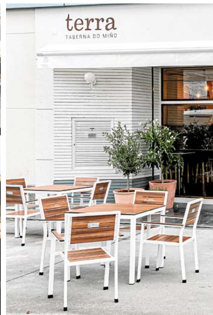
Insatallaciones del hotel Forum Ceao y la Taberna Terra do Miño.