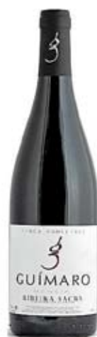
Guímaro Finca Pombeiras.

El tinto El Pecado, alcanzó los 98 puntos en la Guía Parker en la cosecha del año 2005 y sigue dando que hablar cada nueva añada, hasta el punto de estar considerado como uno de los cien mejores vinos del mundo. Las otras referencias son los mencías Guímaro, así como los que llevan los nombres de los viñedos donde se pro-