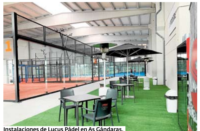
Instalaciones de Lucus Pádel en As Gándaras.