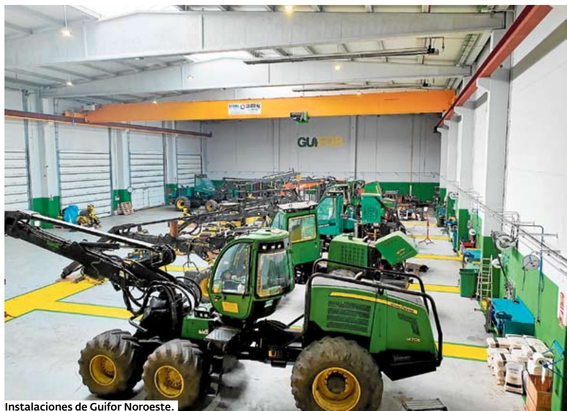
Instalaciones de Guifor Noroeste.

La política de GUIFOR es proporcionar a sus clientes productos y servicios que les ayuden a desempeñar su actividad de forma eficiente y productiva. Por esa razón sólo trabaja con producto certificado y de primer nivel. Un equipo humano caracterizado por su profesionalidad llevan a cabo la comercialización, reparaciones y puesta a punto de máquinas, así como el suministro de recambios y consumibles.