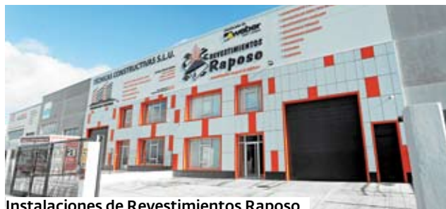
Instalaciones de Revestimientos Raposo.

El personal de Raposo está especializado en el sistema de aislamiento térmico SATE, en revestimientos con mortero monocapa o acrílico, en procedimientos