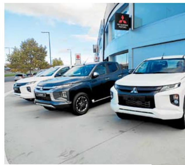
Exterior del concesionario Mitsubishi en O Ceao.

Otra opción es el modelo más urbano de Mitsubishi, el Space Star, se ha renovado profundamente en cinco aspectos básicos, como son el diseño exterior, un mayor equipamiento de serie, nuevo motor 1.2 de 80 caballos, cinco años de garantía y asistencia. Sin duda quien quiera adquirir un vehículo de calidad con el mejor asesoramiento tiene