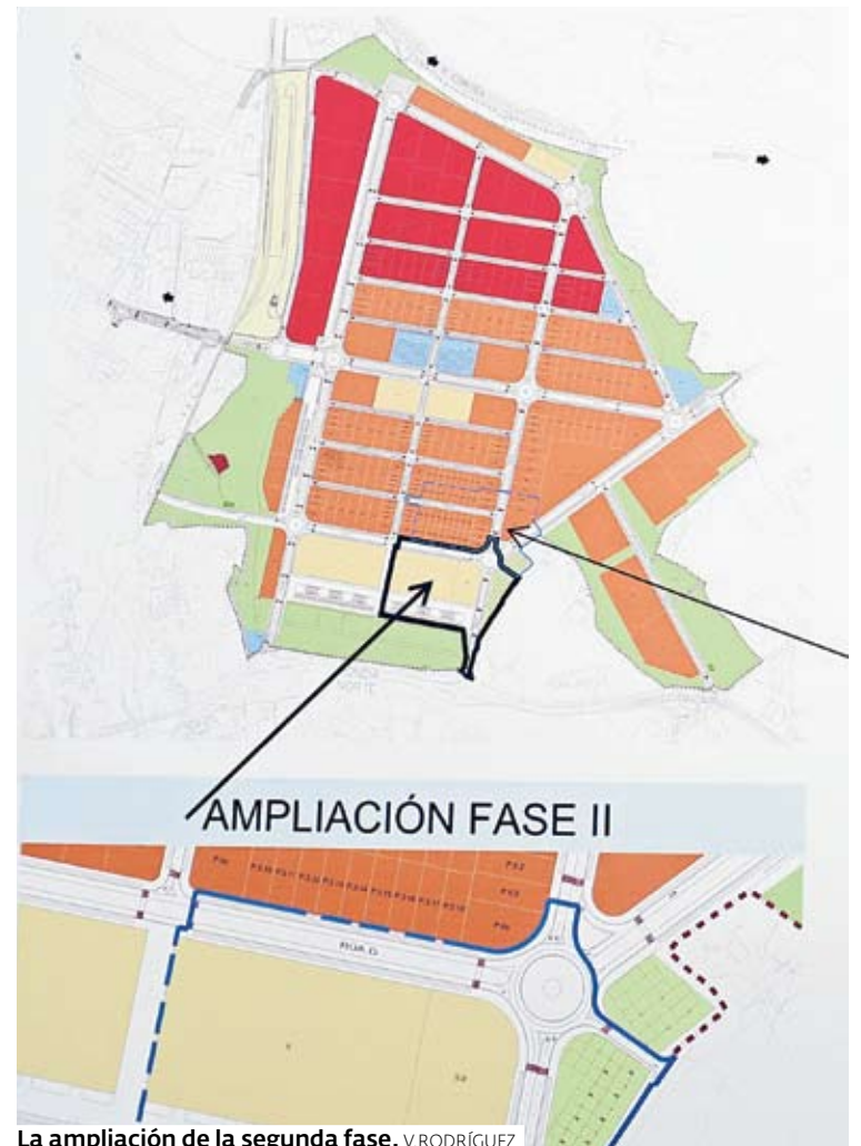
La ampliación de la segunda fase. V. RODRÍGUEZ

El Concello le cederá a la adjudicataria del servicio una parcela de unos 12.000 metros cuadrados de superficie en el parque empresarial, en la que está obligada a acondicionar una planta de gas para que reposten sus vehículos.