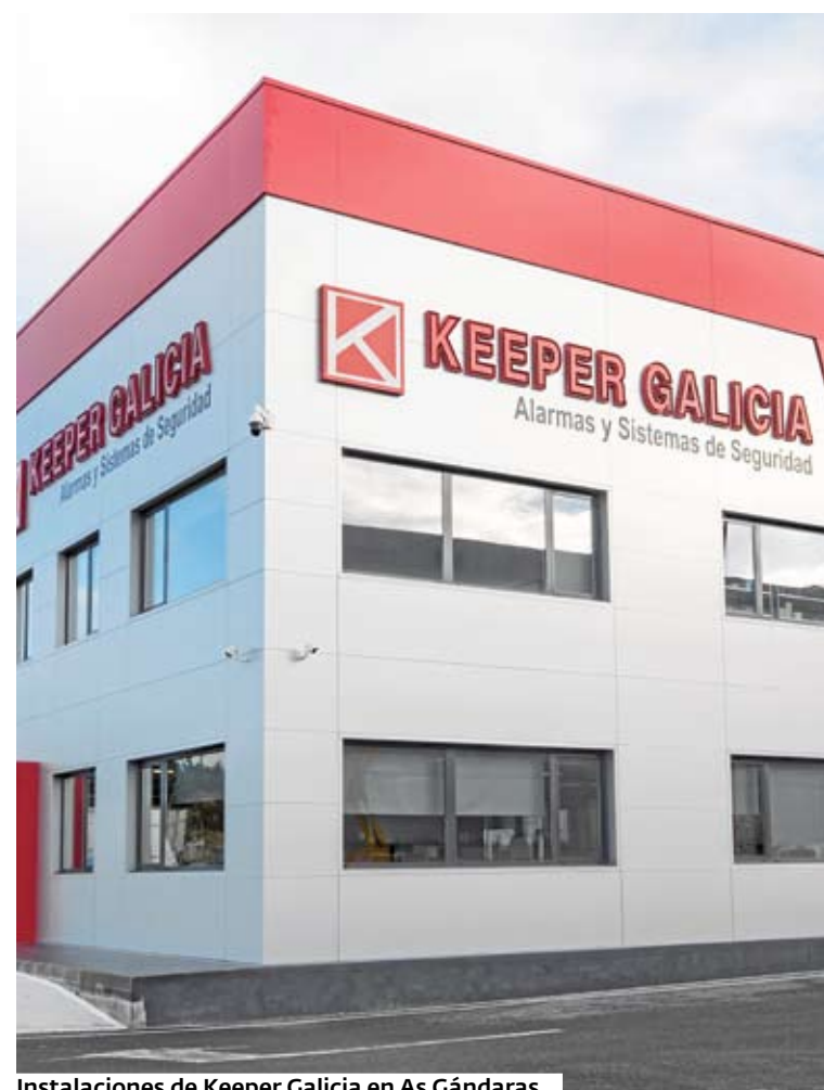
Instalaciones de Keeper Galicia en As Gándaras..

Esta empresa ofrece la opción de conectarse con Central de Receptora de Alarma con aviso a Policía y petición de Auxilio. «Keeper Galicia cumple este año 25 años haciendo de nuestro entorno un lugar más seguro. A través de sus servicios busca mejorar: «la convivencia de nuestra sociedad», señalan.