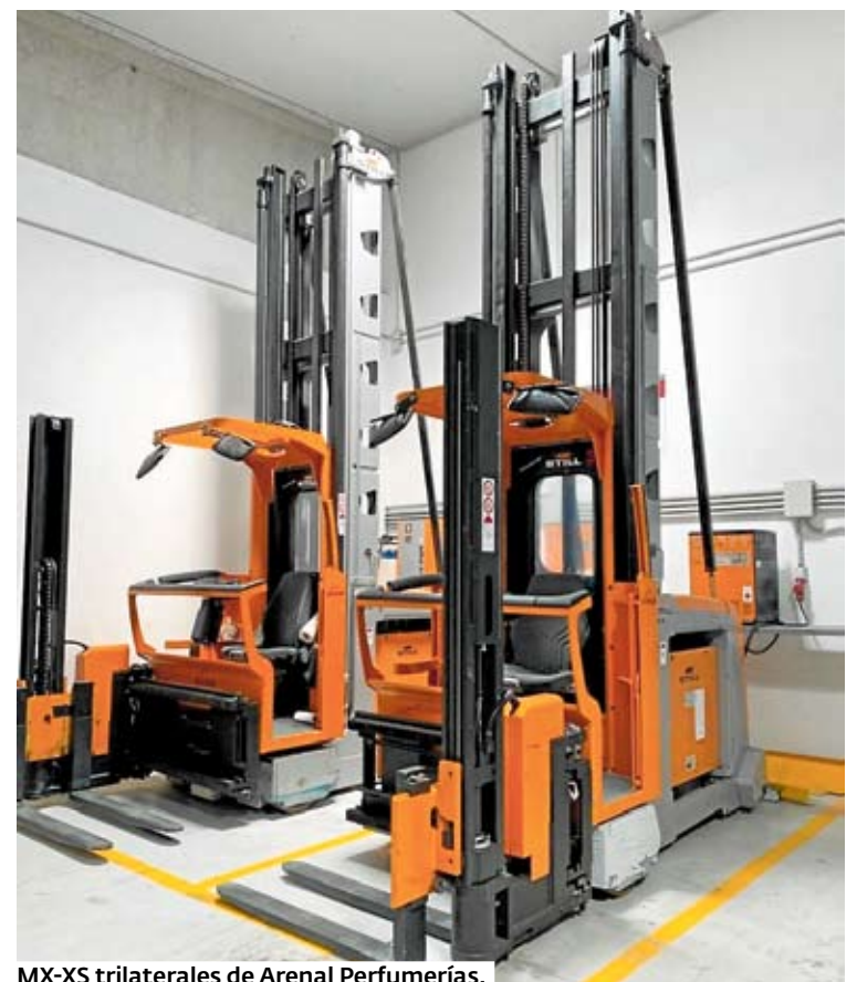
MX-XS trilaterales de Arenal Perfumerías.

Galman Lugo es una de las principales empresas gallegas en el sector industrial distribuidor con los fabricantes de las primeras marcas, y la más completa gama de pro-