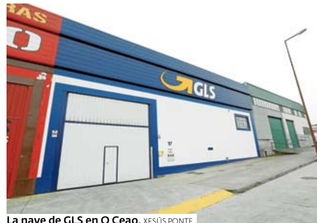
La nave de GLS en O Ceao. XESÚS PONTE