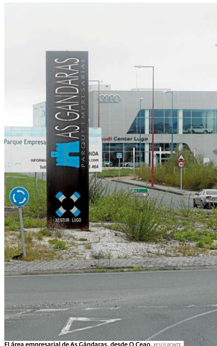
El área empresarial de As Gándaras, desde O Ceao. XESÚS PONTE

Xestur Lugo fue la entidad encargada de promocionar y gestionar el parque empresarial de As Gándaras. Está prevista la urbanización de un total de 2.135.512 metros cuadrados brutos, más de un millón neto, en 237 parcelas.