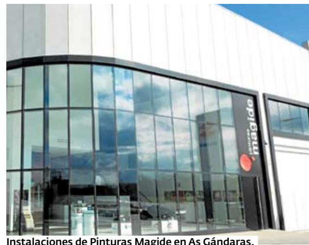
Instalaciones de Pinturas Magide en As Gándaras.

«Atendemos principalmente a tres líneas diferenciadas: carrocería, industria y decoración. Estamos respaldados por las mejores marcas de pintura, recubrimientos y auxiliares a nivel mundial, que avalan cada proyecto con total garantía», indican. En decoración disponen de una amplia oferta de suelo laminado, parquet, suelo vinílico, papel pintado, tratamientos para la madera, pintura de interior y exterior, aislamiento térmico, herramientas y todo tipo de auxiliares. Estudian la elección de las marcas con los últimos avances tecnológicos, para garantizar resultados de lujo. «Cui-